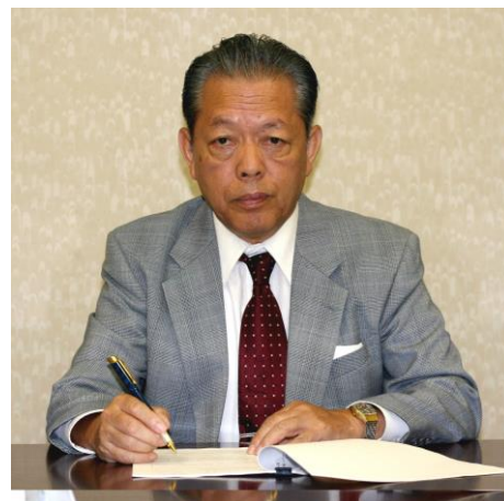
（本項が取り上げている年代の終わりの頃）